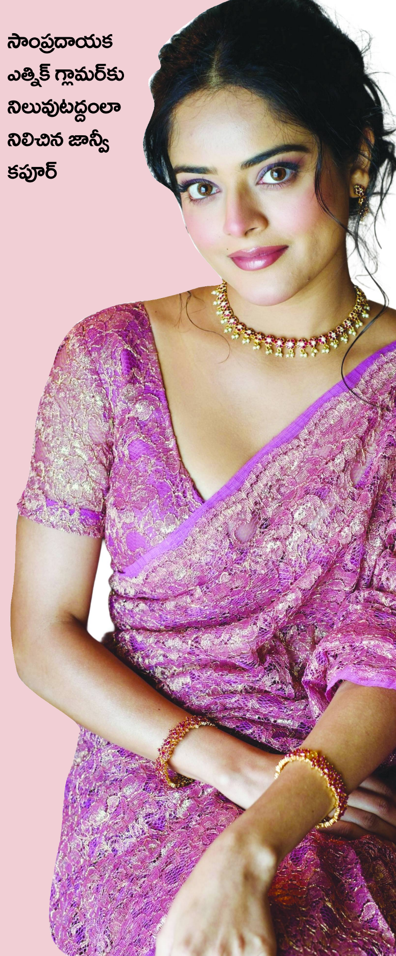
సాంప్రదాయక ఎత్తిక గ్లామర్ కు నిలుపుటద్దంలా నిలిచిన జాన్వీ కపూర్