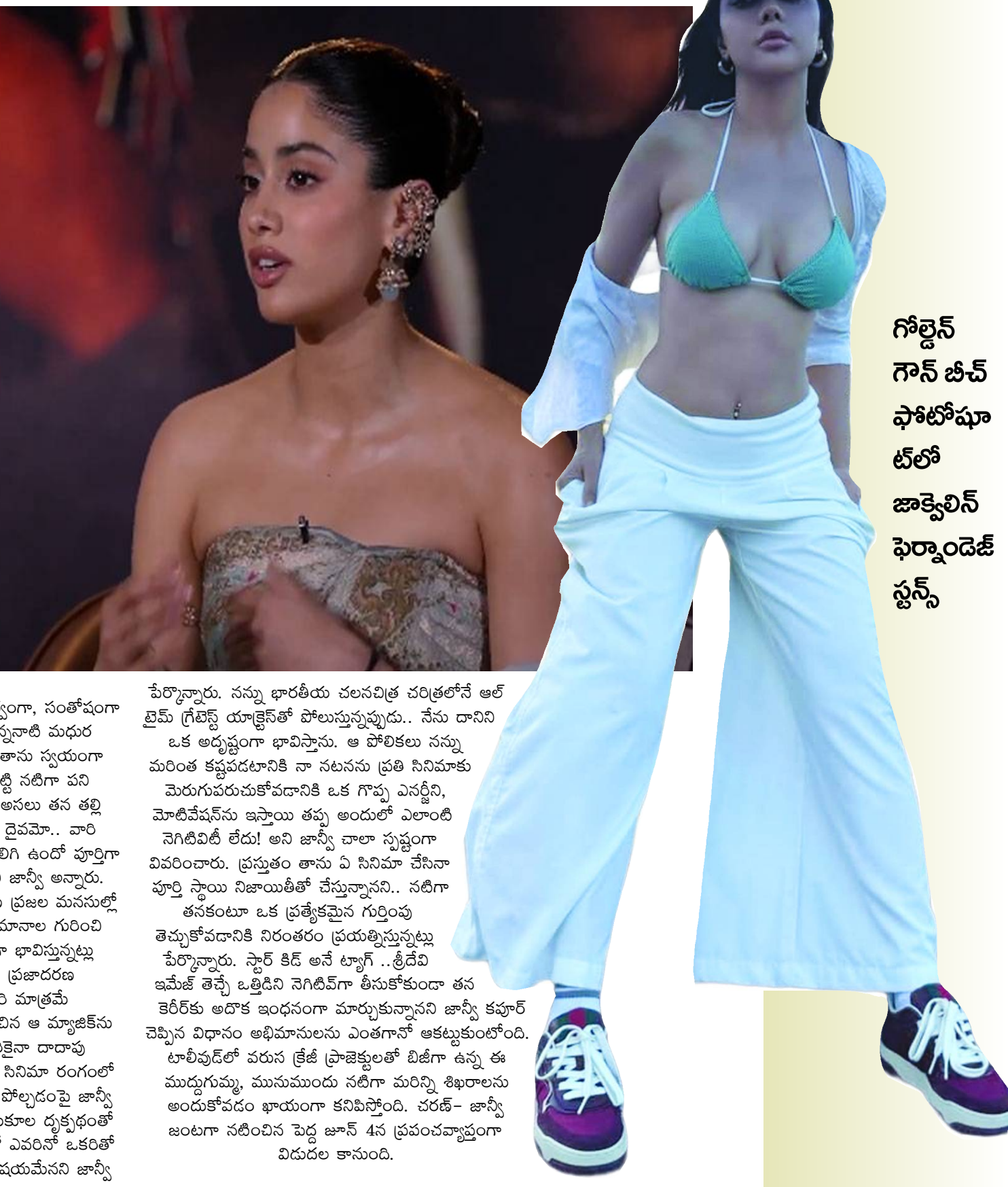
గోల్డెన్ గాస్ బీచ్ ఫోటోషూట్లో జాక్వెలిన్ ఫెర్నాండెజ్ స్టైల్స్

పేర్కొన్నారు. నన్ను భారతీయ చలనచిత్ర చరిత్రలోనే ఆల్ టైమ్ గ్రేటెస్ట్ యాక్ట్రెస్ తో పోలుస్తున్నప్పుడు.. నేను దానిని ఒక అదృష్టంగా భావిస్తాను. ఆ పోలికలు నన్ను మరింత కష్టపడటానికి నా నటనను ప్రతి సినిమాకు మెరుగుపరుచుకోవడానికి ఒక గొప్ప ఎనర్జీని, మోటివేషన్ ను ఇస్తాయి తప్ప అందులో ఎలాంటి నెగిటివిటీ లేదు! అని జాన్వీ చాలా స్పష్టంగా వివరించారు. ప్రస్తుతం తాను ఏ సినిమా చేసినా పూర్తి స్థాయి నిజాయితీతో చేస్తున్నానని.. నటిగా తనకంటూ ఒక ప్రత్యేకమైన గుర్తింపు తెచ్చుకోవడానికి నిరంతరం ప్రయత్నిస్తున్నట్లు పేర్కొన్నారు. స్టార్ కిడ్ అనే ట్యాగ్.. శ్రీదేవి ఇమేజ్ తెచ్చే ఒత్తిడిని నెగిటివ్ గా తీసుకోకుండా తన కెరీర్ కు అడ్డంకు కాకుండా మార్చుకున్నానని జాన్వీ కపూర్ చెప్పిన విధానం అభిమానులను ఎంతగానో ఆకట్టుకుంటోంది. టాలీవుడ్ లో వరుస క్రేజీ ప్రాజెక్టులతో బిజీగా ఉన్న ఈ ముద్దుగుమ్మ, మునుముందు నటిగా మరిన్ని శిఖరాలను అందుకోవడం ఖాయంగా కనిపిస్తోంది. చరణ్ - జాన్వీ జంటగా నటించిన పెద్ద జూన్ 4న ప్రపంచవ్యాప్తంగా విడుదల కానుంది.